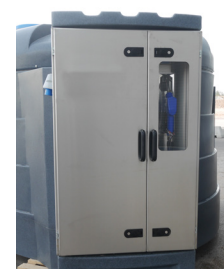
Paneeli säiliöjärjestelmään asennusta varten on saatavilla lisätarvikkeena.