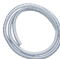
980013, letku, metritavara