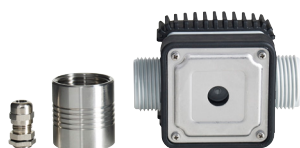
980022, sykäsmittari K24