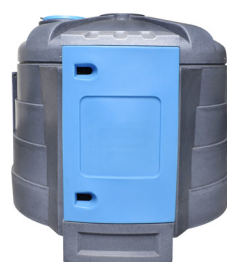
Vakiomallinen rakenne edessä.