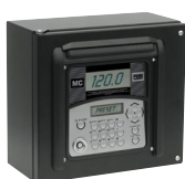
980021, MC Box