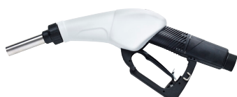
980014, automaattinen pistoolikahva